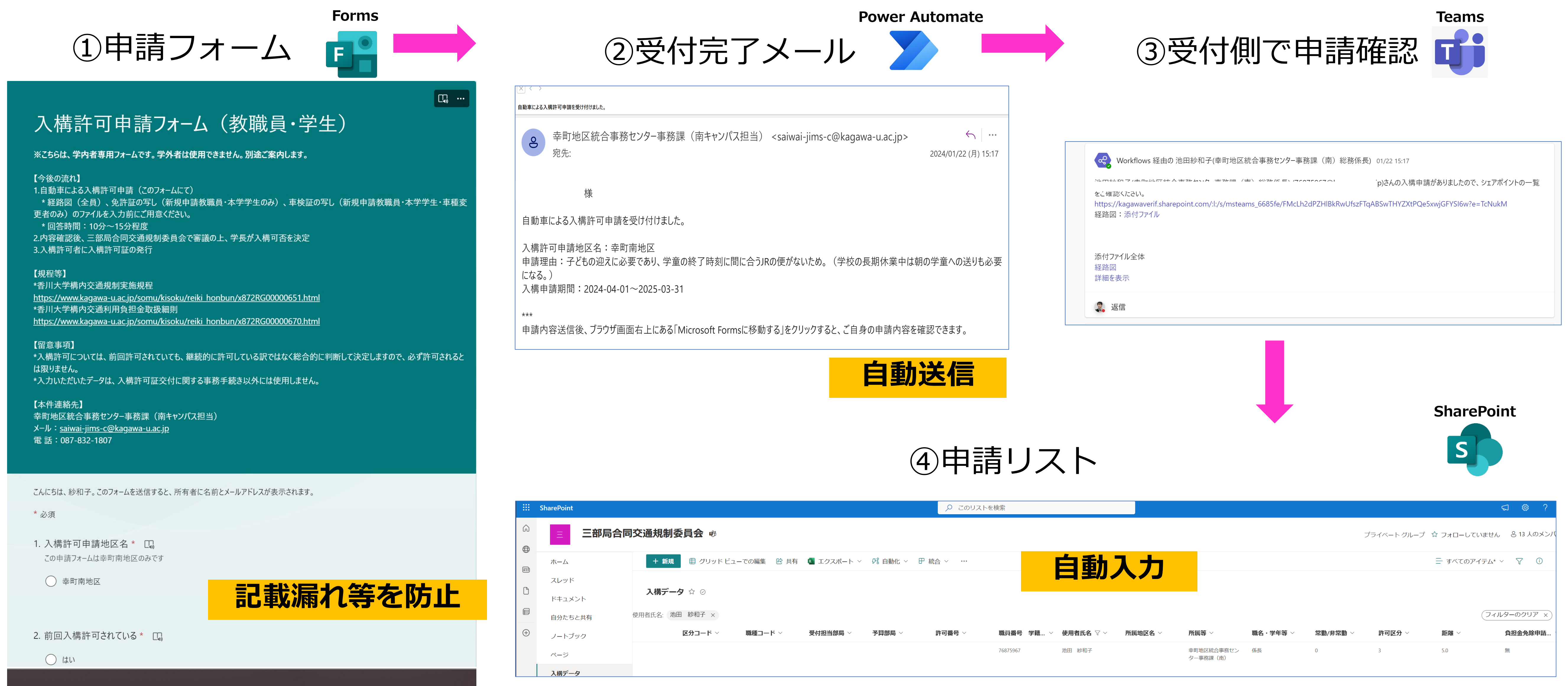
図 システム導入後の業務フロー（2024年1月から幸町南キャンパスにて運用開始）